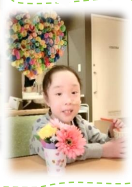
バレンタインデー♡