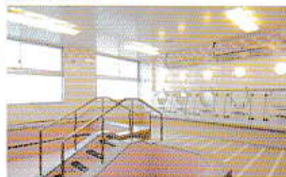
■特養・ショート共有(浴室)