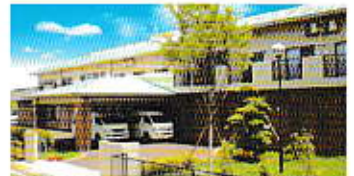
特別養護老人ホーム 印旛晴山苑 〒270-1612 千葉県印西市大庭(おおば)187 TEL.0476-99-2522 (代)