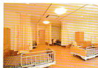
■短期入所の4人部屋