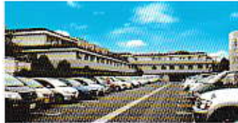
介護老人保健施設 晴山会ケアセンター 〒262-0043 千葉県千葉市花見川区天戸町1483-4 TEL.043-257-0055 (代)