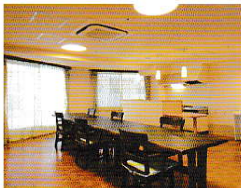
■ショートステイサービス(食堂)