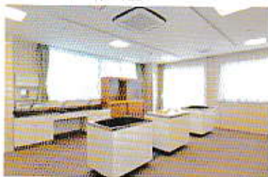
■工芸作業コーナー