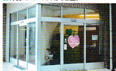
■訪問看護ステーション