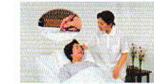
訪問看護・訪問介護・居宅支援事業 (ケアプラン作成) 花見川訪問看護ステーション 〒262-0043 千葉県千葉市花見川区天戸町1495-4 TEL.043-286-1003