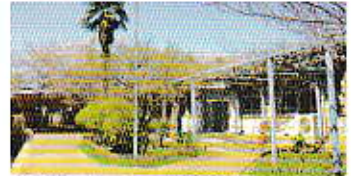
障害福祉サービス事業所 桜が丘晴山苑 〒264-0017 千葉県千葉市若葉区加曾利町1536 TEL.043-231-4321 (代)