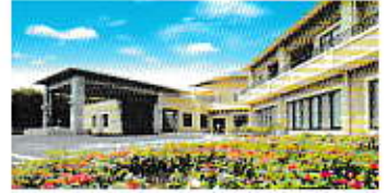
特別養護老人ホーム 土浦晴山苑 〒300-0024 茨城県土浦市田村町2321-5 TEL.029-828-2322 (代)