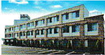
平山病院 〒262-0046 千葉県千葉市花見川区花見川1494-3 TEL.043-259-4525 (代)