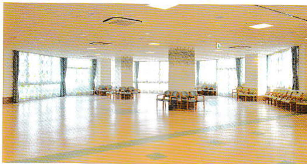
■共同食堂・集会室