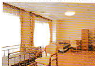
■短期入所の2人部屋

居宅においてその介護を行うひとが疾病その他の理由により介護が困難な場合などに、障害者施設その他の施設で短期間、夜間を含めて提供するサービスです。主なサービス内容として、入浴・排泄、食事等の介護およびその他日常生活上の介護や支援を行います。一人ひとりが過ごしやすいように配慮した支援を提供します。