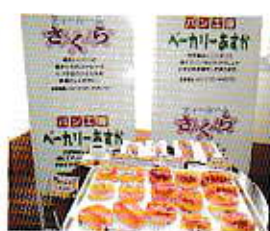
■ティールームさくら・ パン工房ベーカリーあすか