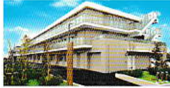
サービス付き高齢者向け住宅 メディカルナーシングヴィラ花見川 TEL.043-259-4566 (代) 平山病院附属 花見川腎クリニック TEL.043-259-4100 (代) 〒262-0043 千葉県千葉市花見川区花見川1483-28