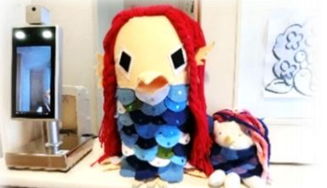
正面玄関にいる「アマビエ」

しかしながら、新型コロナウイルス感染症の猛威は、人と人とのつながりを奪うかのような存在に感じてなりません。新しい生活様式の中で「支え合う」ことの手段が変わっても、人間の基礎となる人とのつながりは大切にしていきたいものです。